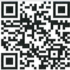
BORANG NP(S) 8.2.2023